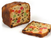
Pastel de frutas